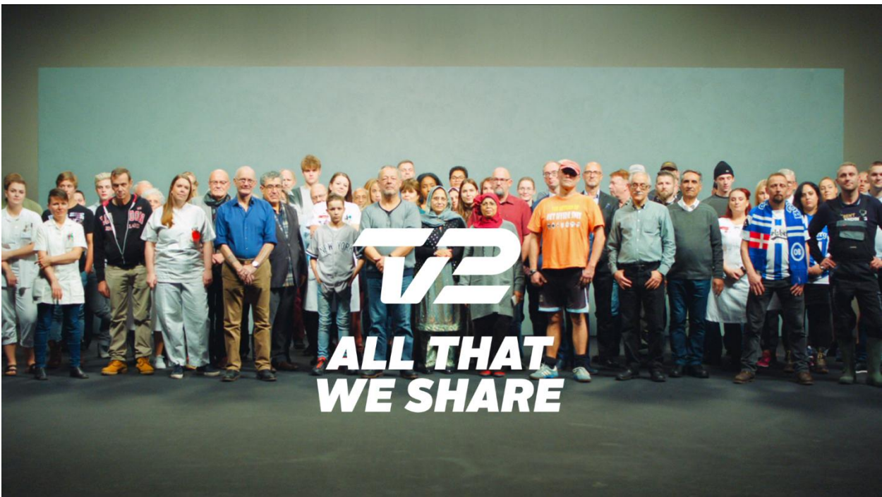
TV 2 Denmark: 'All that we share'

In diesem Jahr wurde ein Spezialpreis für besonders kreative und effektive Leistungen an die Sender-Kampagne von TV 2 Denmark 'All that we share' vergeben. Die Jury sagt: "Diese Kampagne ist ein strategisches Meisterstück. In den Spots geht es darum, sich auf Gemeinsamkeiten von Menschen statt auf deren Unterschiede zu konzentrieren. Weltweit wurde das Viral millionenfach geteilt. Dieser Spot wurde zu einem verbindenden Faktor in der Digital-Welt als die Zuschauer ihn in mehr als dreißig Sprachen übersetzten. Emotional und nachdenklich stimmend mit globaler Wirkung!"