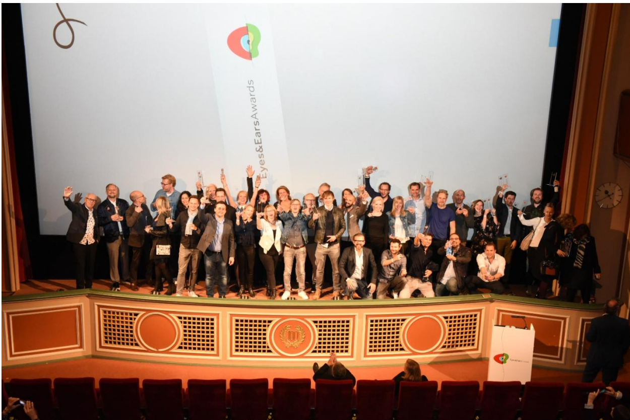
Preisträger der 19. Internationalen Eyes & Ears Awards

Köln, 25.10.2017 – das Filmtheater am Sendlinger Tor war gestern Abend bis auf den letzten Platz besetzt. Grund dafür war die Vergabe der 19. Internationalen Eyes & Ears Awards, zu der 400 Gäste gekommen waren, um die besten Produktionen aus den Bereichen 'Design', 'Digital', 'Promotion' und 'Cross-Media-Kampagnen' zu sehen und zu feiern. Moderiert wurde die Show von Wolfram Kons und Corinna Kamphausen, CEO von Eyes & Ears of Europe.