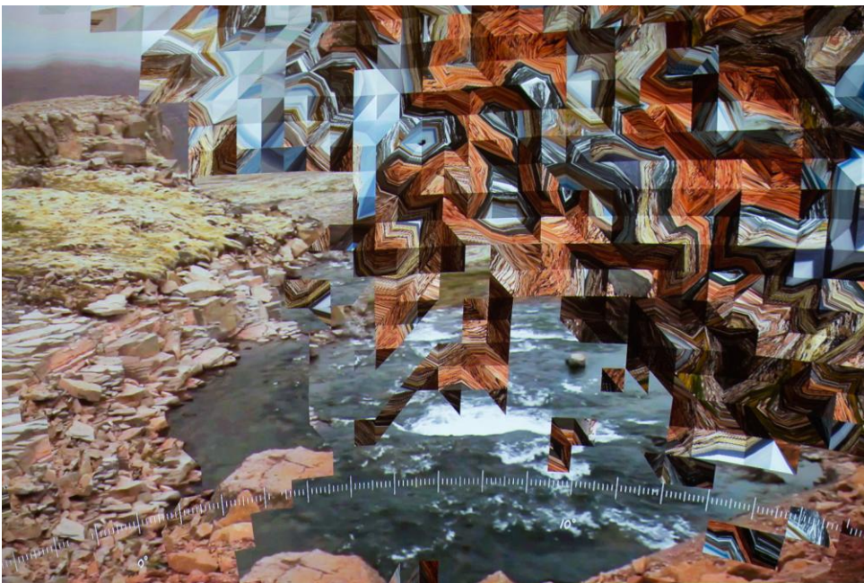
Auszug aus dem Corporate Design für 'Neuland'